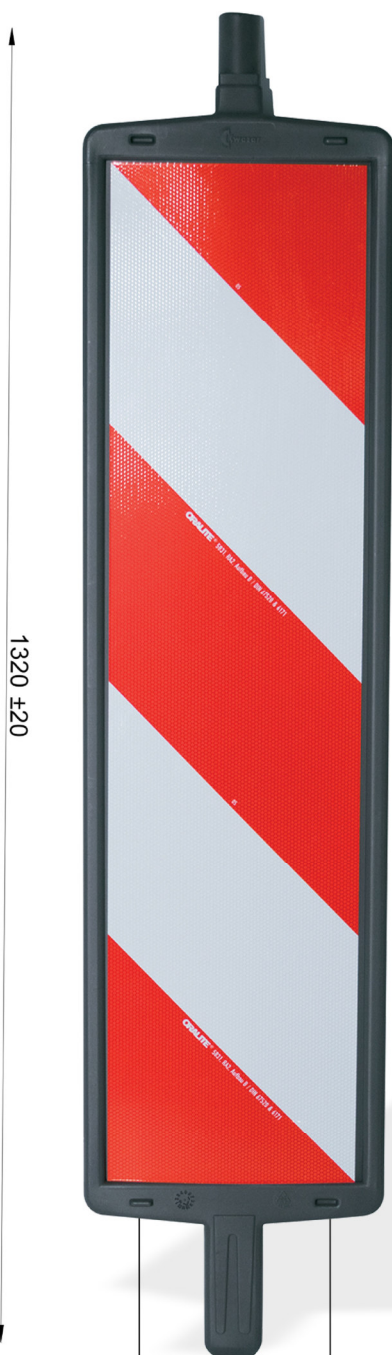
butées pour l'empilage des balises