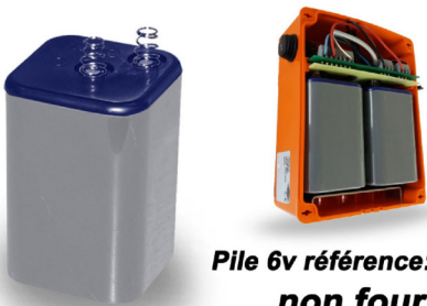
Pile 6v référence: 50 05 02 non fournie

Feux conformes classe L2H suivant paragraphe 4.1.1 norme EN 12352.