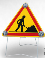
Ak5 triflash réf: 52 20 64