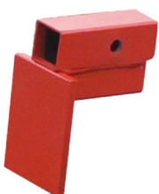
Platine de rechange Réf. 40 19 53

Longueur : 1400 mm Largeur : 350 mm Poids : 10 kg Conditionnement par 1 pièce