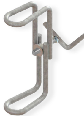
Coulisseau simple fil acier galvanisé diam. 12 mm, 1 manette de serrage.