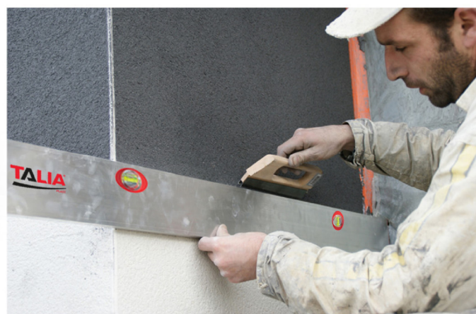
S'utilise avec une règle de façadier (pour guider la sciote)