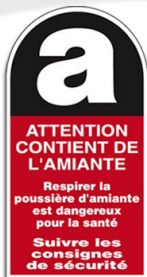
Planche d'étiquettes adhésives

330x75mm réf.625333 330x120mm réf.626333