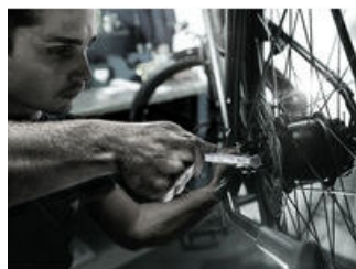
Joker 6003 taille 9 pour travailler sur les dérailleurs de vélo

6003 Clés mixtes Joker - Côté fourche avec un angle de reprise de 15° seulement. Quand il faut jouer serré !