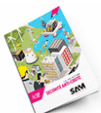
Sécurité anti-chute SAM 2017