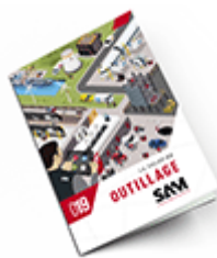
Outillage SAM 2019