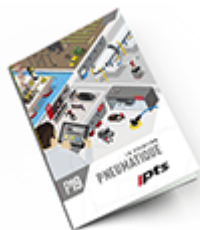
Pneumatique SAM 2019