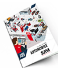
Automobile SAM 2019