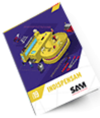
Les outils Indispensables 2019

Découvrez tous nos produits dans nos catalogues en ligne