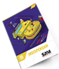
Les outils Indispensables 2019

Découvrez tous nos produits dans nos catalogues en ligne