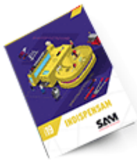
Les outils Indispensables 2019