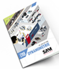
Dynamométrie SAM 2019