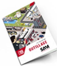
Outillage SAM 2019