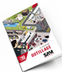
Outillage SAM 2019