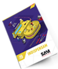
Les outils Indispensables 2019