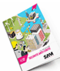
Sécurité anti-chute SAM 2017