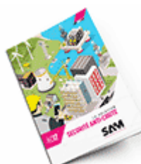
Sécurité anti-chute 2017