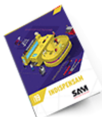
Les outils Indispensables SAM 2019

Découvrez tous nos produits dans nos catalogues en ligne