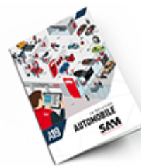
Automobile SAM 2019