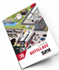
Outillage SAM 2019