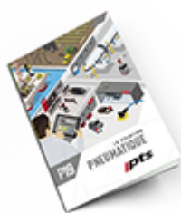
Pneumatique SAM 2019