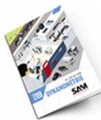
Dynamométrie SAM 2019