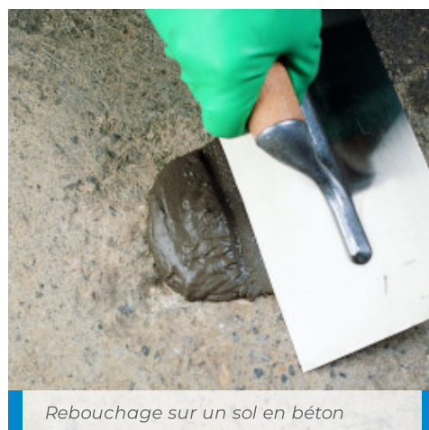
Rebouchage sur un sol en béton