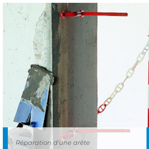
Réparation d'une arête