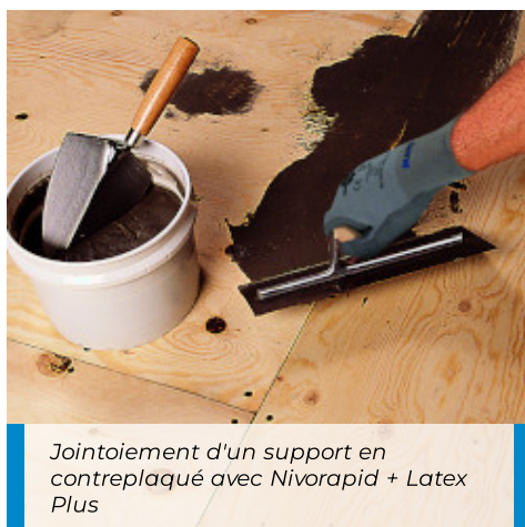
Jointoiement d'un support en contreplaqué avec Nivorapid + Latex Plus