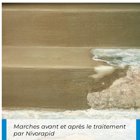
Marches avant et après le traitement par Nivorapid