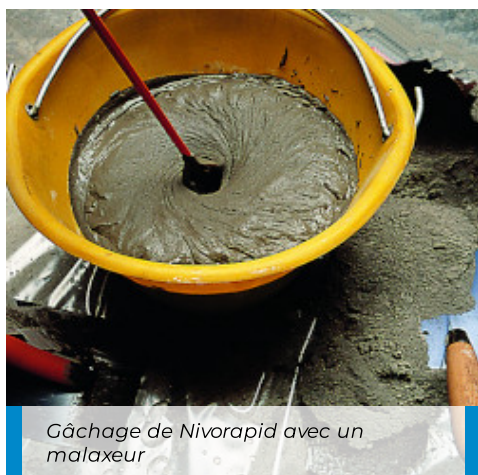
Gâchage de Nivorapid avec un malaxeur