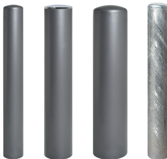
Réf. 206516 Ø 160 mm