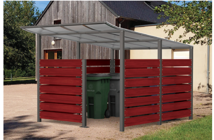
Réf. 529782 + 529787