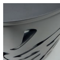
Option écrase cigarette Réf. 208181