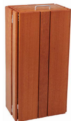
Bois lasuré chêne clair