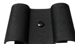
Pièce de liaison en option SI-VIPL-001