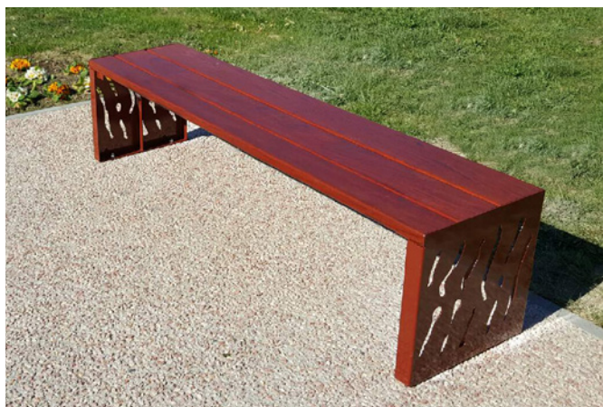
Version acier et bois - Réf. 209169