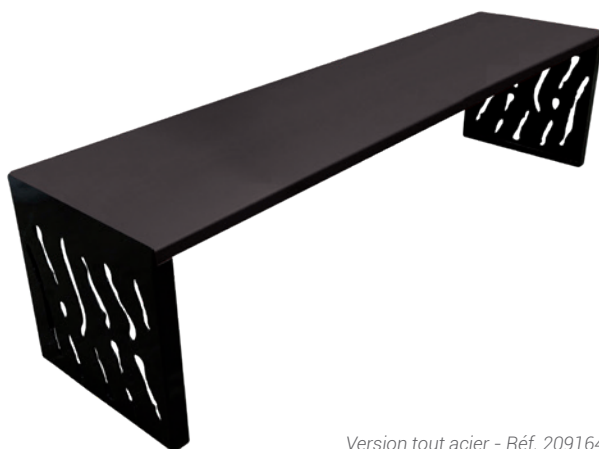
Version tout acier - Réf. 209164