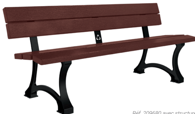
Réf. 209680 avec structure en finition noir