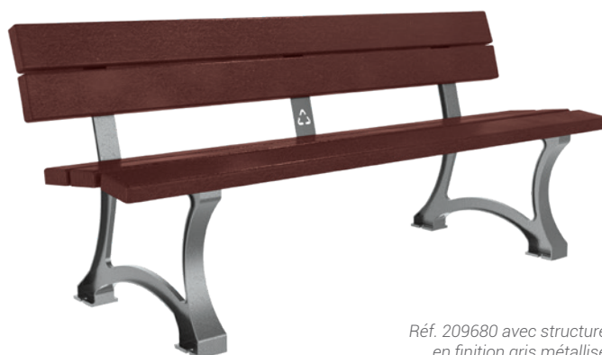
Réf. 209680 avec structure en finition gris métallisé