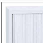
Gris RAL 7035

Contactez nous pour d'autres coloris non standards