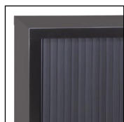
Anthracite RAL 7016 Noir