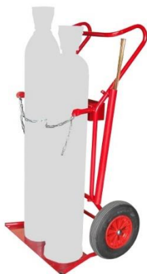
812 007 959 – Fourreau pour baguettes de soudure 700mm de long, Ø 45mm