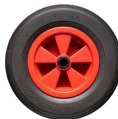
812 009 488 – Roues increvables Roulage optimisé jusqu'à 200 kg