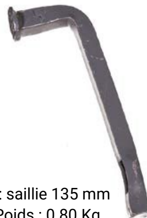
Valet seul : saillie 135 mm SJ 1047 - Poids : 0.80 Kg

Nos produits sont susceptibles d'évoluer, documentation et textes non contractuels.