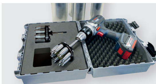
Kit évaseurs à galets Ø 80 et 100 mm (visseuse non fournie)