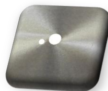
Alésage 25,4 (Autres alésage sur demande)