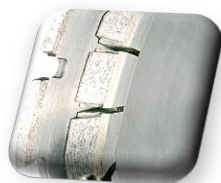
Largeur 14 mm, pour des chanfreins de 2 mm à 25 mm de largeur