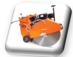
Disque spécial pour Scie à sol de 20 à 50 Cv