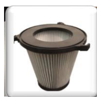
Filtre antistatique à cartouche en polyester Classe "M"