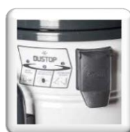
Système de nettoyage du filtre par guillotine pour système DUSTOP