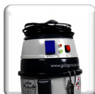
Enrouleur intégré pour rangement du câble.