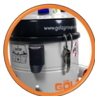
Grande cartouche filtrante (surface filtre 30000 cm 2 ).