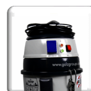
Indicateur de dépression pour un contrôle continu du fonctionnement et de l'état du filtre