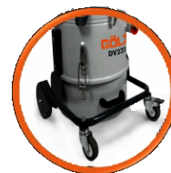
Maniabilité avec ses 4 roues pour une utilisation simplifiée.

Aspirateur compact pour poussières et solides.