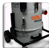
Bac collecteur de 13 L, extractible permettant un vidange pratique et en toute sûreté