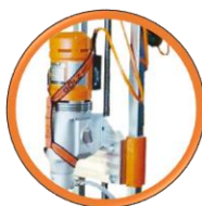
Guidage du chariot par Glissoirs téflon