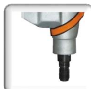
Emmanchement, Raccord 1 1/4" UNC