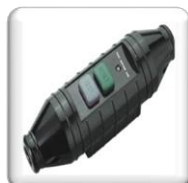
Sécurité Commutateur PRCD 30 MA