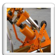
Carottage 45°. Fixation par sangle et cliquet (accessoire inclus)