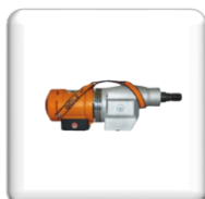
Moteur BBM33 L Extra, électrique 3,3 Kw