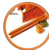
2 piquets de terre et 1 Sangle 2,1 m avec cliquet inclus

L'originale pour les canalisations, l'experte dans l'assainissement avec moteur électrique BBM33 L Extra.