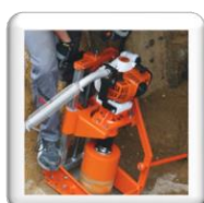
Carottage 90° sur tuyau d'assainissement. La carotteuse est coincée entre le tuyau et le blindage. Piquet de terre pour sécurité supplémentaire