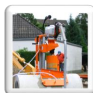
Carottage 90° sur tuyau d'assainissement. Fixation par ventouse (accessoire en option)