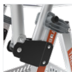
Articulations robustes avec système sécurisé de repliement pour le transport