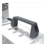
Poignée de transport