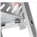
Crochet anti-sou- lèvement