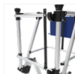
Garde-corps à lisses à fermeture semi-automatique