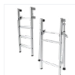
Réhausses télescopiques amovibles