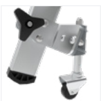
Roues escamotables avant