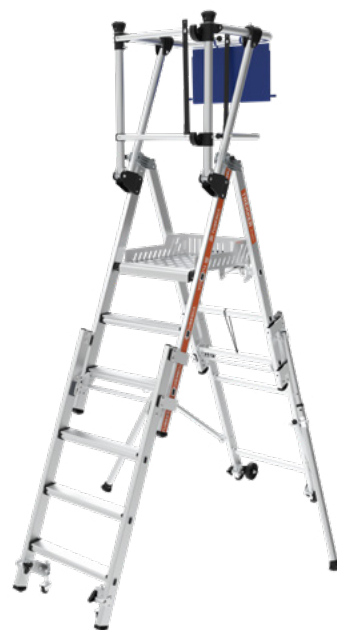
Modèle présenté : 02274360

La gamme Trekker est facile à transporter, à stocker et à utiliser même dans les endroits exigus ou les milieux occupés : sans concession sur la sécurité !