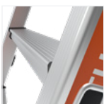
Marches 80 mm