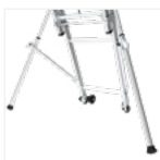
Stabilisateurs réhausse arrière