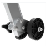
Roues de dépla- cements arrière escamotables