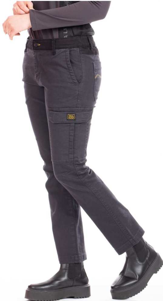
Ref. BETTYC Gris Anthracite

Pantalon de travail, coupe féminine et moderne, arrondie sur les hanches, jambe droite et confortable au niveau du genou. Taille élastique invisible avec personnalisation sur la ceinture permettant un bon maintien du pantalon. Grandes poches avant et arrière, plus une poche latérale pour le mètre et sangle porte marteau s'inspirant des vêtements de travail traditionnels. Twill stretch Fibreflex® 81% coton 17% polyester 2% élasthanne – 280 grammes.