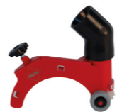
CUT MASTER GUIDE 90° Ref. 40922