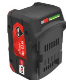
CAS LIPOWER BATTERY 18V 5.2AH Ref. 85902