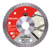
TLG SUPERPRO 125MM Ref. 41901