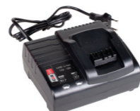
ENERGY CAS CHARGER Ref. 26575