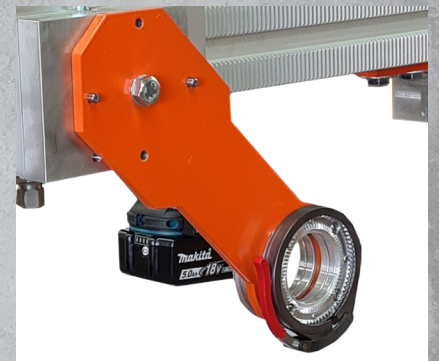
Raccord moteur BELUGA SXM-V