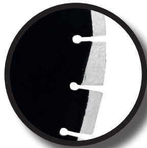
Hauteur de segments 10 mm