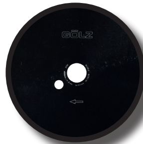
Alésage 25,4 (Autres alésage sur demande)