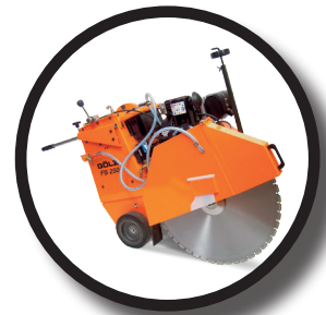
Disque Spécial Scie à sol de 20 à 40 Cv

L'AS22 est un disque diamant de haut de gamme pour l'Asphalte et le Bitume. Des segments spéciaux assurent des vitesses de coupe élevées lors de la coupe de la plupart des matériaux Abrasifs. Segments obliques de protection contre le laminage sous segment.