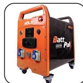
Batterie BATTPAK 5048