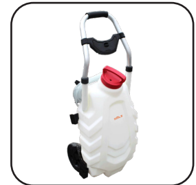
Réservoir à batterie WB28 (28 litres) Raccord Gardena