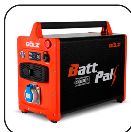
Batterie BATTPAK 3621