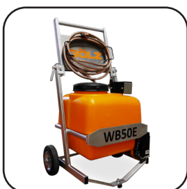
Réservoir à batterie WB50E (50 litres) Raccord Gardena