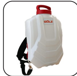
Réservoir à batterie WB16E (16 litres) Raccord Gardena