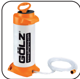
Pulvérisateur PVC 10 L Raccord Gardena