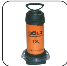
Pulvérisateur Acier 10 L Raccord Gardena