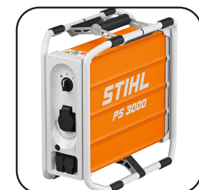
Batterie STIHL PS3000