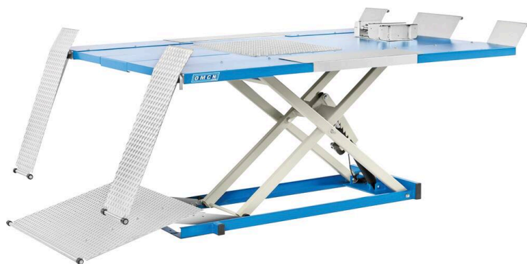
Table élévatrice 400V pour motos-quads-voiturettes