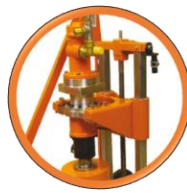
Guidage du chariot par Glisseurs téflon