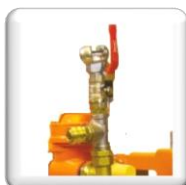
Raccord pneumatique rapide R ¾ "