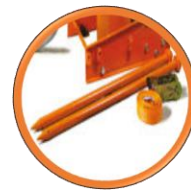
2 piquets de terre et 1 Sangle 2,1 m avec cliquet inclus

L'originale pour les canalisations, l'experte dans l'assainissement avec moteur hydraulique HBM100.