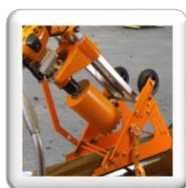
Carottage 45°. Fixation par sangle et cliquet (accessoire inclus)