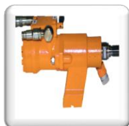
Moteur hydraulique HBM100 de 4,5 Kw