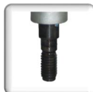
Emmancement, Raccord 1 1/4" UNC