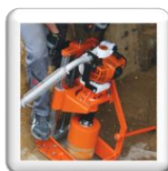
Carottage 90° sur tuyau d'assainissement. La carotteuse est coincée entre le tuyau et le blindage. Piquet de terre pour sécurité supplémentaire