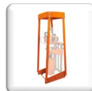
Kit Pelle en Option