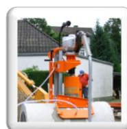
Carottage 90° sur tuyau d'assainissement. Fixation par ventouse (accessoire en option)