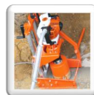
Carottage 90° sur tuyau d'assainissement. Fixation par piquet de terre (accessoire)