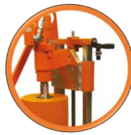
Guidage du chariot par Glissoirs téflon