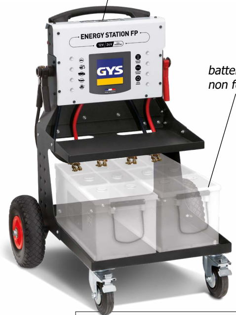
batteries non fournies