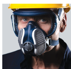
Efficacité Filtration Poussières (0,6 µm)