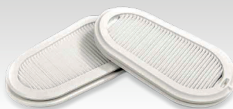
2 filtres de rechange FFP3 037038