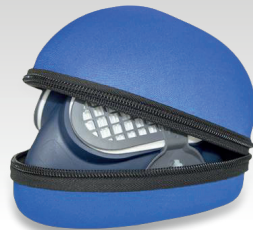
Étui de rangement 037045