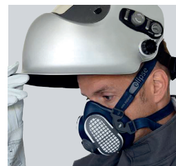
Efficacité Filtration Poussières (0,6 µm)