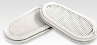
2 filtres de rechange FFP3 037038