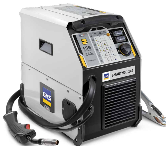
Livré avec câble de masse et torche fixe 2m.

Son ventilateur à débit constant le protège des surchauffes