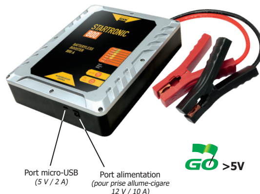
Port micro-USB (5 V / 2 A)