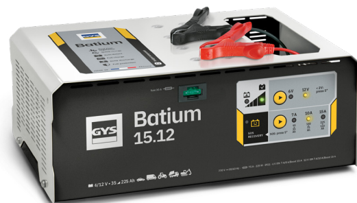
Interface simple d'utilisation